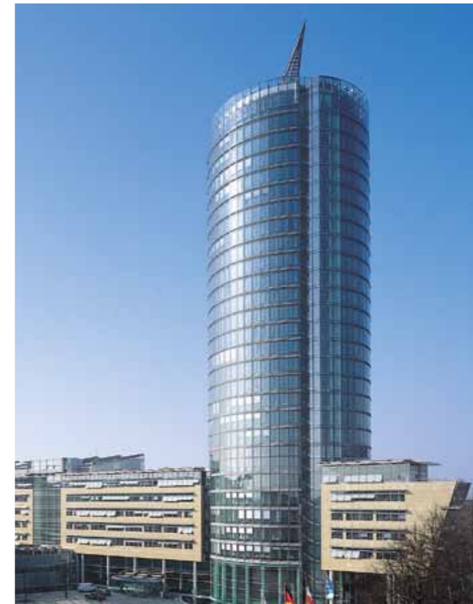
ERGO Headquarter Düsseldorf

Customers can talk to more than 50,000 full-time and self-employed sales representatives, direct sales staff, brokers, agents and strong cooperation partners both at home and abroad.