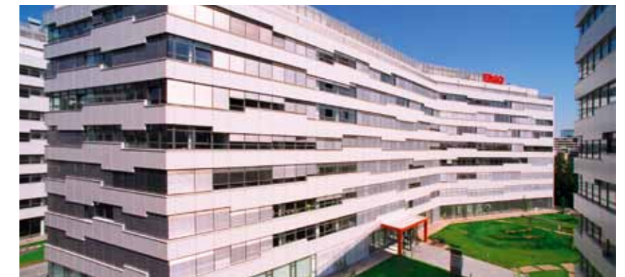
Headquarter ERGO Center Vienna

zur langfristigen Vermögensbildung an. Die Versicherungen werden außerdem über unabhängige Versicherungsagenturen und Makler angeboten. In einer eigenen Gesellschaft, der ERGO Insurance Service GmbH, sind zentrale Dienstleistungen für alle Gesellschaften der ERGO Austria, sowohl in Österreich als auch in den Auslandsgesellschaften, zusammengefasst.